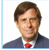
Ignacio García de Vinuesa Alcalde de Alcobendas

El trabajo conjunto de todos los servicios municipales, bajo la coordinación de la concejal de Integración, ha hecho posible que hoy tengas en tus manos una Guía que estoy seguro te ayudará a sentirte más cerca de tu Ayuntamiento y mejor integrado en Alcobendas.