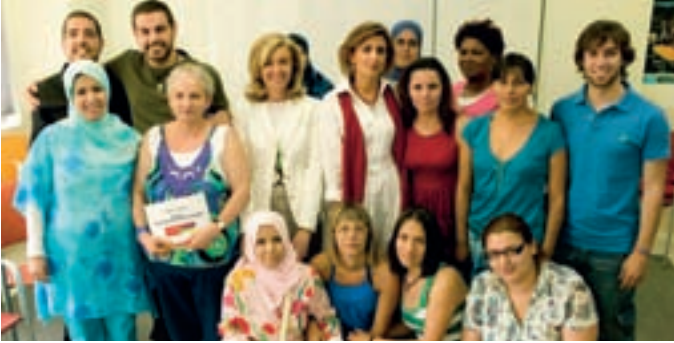
La concejal de Inmigración y Mujer, acompañada de la directora de inmigración, junto con algunos participantes de los talleres.

La Federación de Ecuatorianos en Madrid, en colaboración con la Comunidad de Madrid y el Ayuntamiento de Alcobendas, ha organizado Aula móvil por la igualdad . Se trata de una serie de cursos, que se prolon-