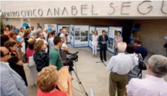
El alcalde, con las concejales de Obras y Distrito Urbanizaciones, inauguró la muestra.

Varios centenares de vecinos han visitado la exposición sobre las mejoras del Distrito Urbanizaciones, que se ha podido visitar del 18 al 25 de