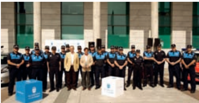
Los policías locales junto al alcalde y el concejal de Seguridad Ciudadana en la presentación de los nuevos uniformes.

Los 250 funcionarios que conforman la plantilla de la Policía Local estrenan nuevo uniforme. El amarillo fluorescente ha sido sustituido por el conocido como 'azul ducados' y reincorpora el anterior escudo metálico. Alcobendas es el primer municipio de la Comunidad de Madrid que adopta el dispositivo reflectante de color azul para este cuerpo policial.