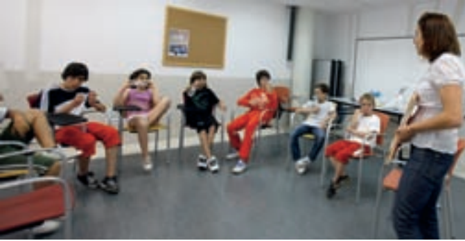
Miembros del Consejo de Infancia en una de sus reuniones en Imagina.

El Consejo de Infancia representará a los niños de Alcobendas en los II Encuentros de la Red Local a Favor de los Derechos de la Infancia y la Adolescencia, que se celebrarán este sábado, 20 de junio, en Rivas Vaciamadrid y en los que también participarán los