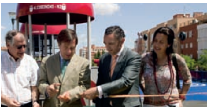
El alcalde y los concejales de Medio Ambiente, Obras y Distrito Norte en la inauguración del 'Parque del Espacio'.

Ésta es la tercera de las zonas temáticas infantiles con las que, por el momento, cuenta Alcobendas. Las otras dos están en Fuente Lucha ( Poblado del Oeste ) y Arroyo de la Vega ( Barco Pirata ). Próximamente habrá otra en el Parque de Galicia, pero el tema sobre el que girará es todavía una sorpresa y también, dentro del proyecto, habrá una quinta zona.