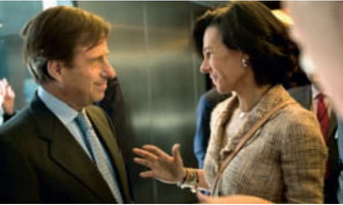
El alcalde conversa con Ana Patricia Botín en un descanso del foro.

El Ayuntamiento de Alcobendas ha participado como socio líder en el XVII Foro del Club Excelencia en Gestión, celebrado bajo el lema 'Innovar en tiempos difíciles. Nuestra apuesta de futuro', al que han acudido políticos, ex ministros y empresarios.