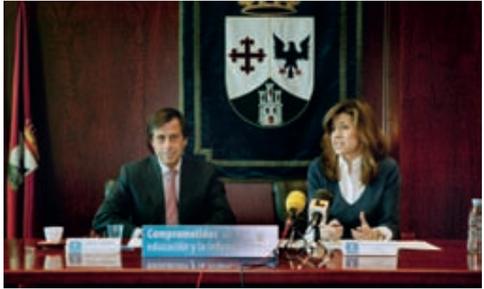
El alcalde y al concejal de Educación en el encuentro con los medios.

Para ayudar a los padres a elegir dónde estudiarán sus hijos,