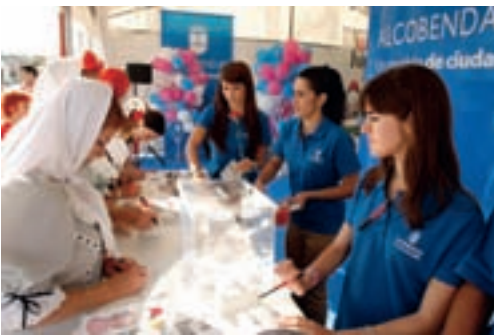
Más de 4.000 personas regalaron su idea para las fiestas de 2010 en la caseta institucional.