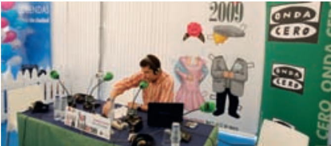
Onda Cero, Ser Madrid Norte y Punto Radio emitieron desde el recinto ferial programas especiales de radio con Alcobendas y sus fiestas como protagonistas.