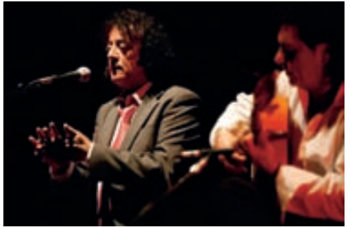
Las fiestas comenzaron con la Semana Flamenca, que un año más no defraudó a los amantes del cante.