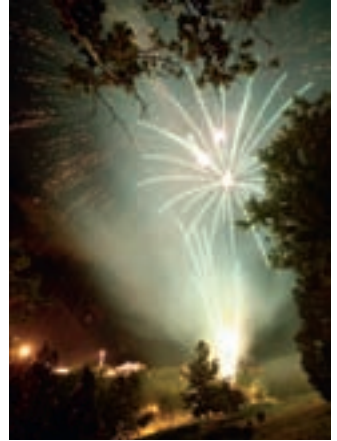
Un magnífico espectáculo de fuegos artificiales sirvió como pistoletazo de salida de los principales días festivos.