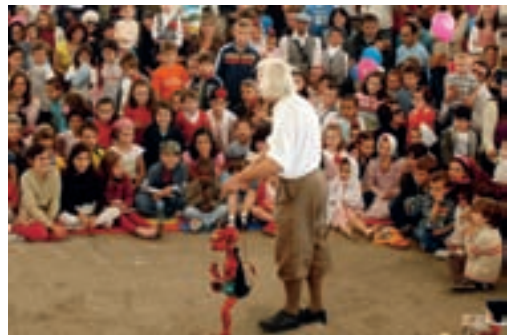
Los más pequeños de la casa pudieron disfrutar de las diferentes actuaciones familiares programadas.