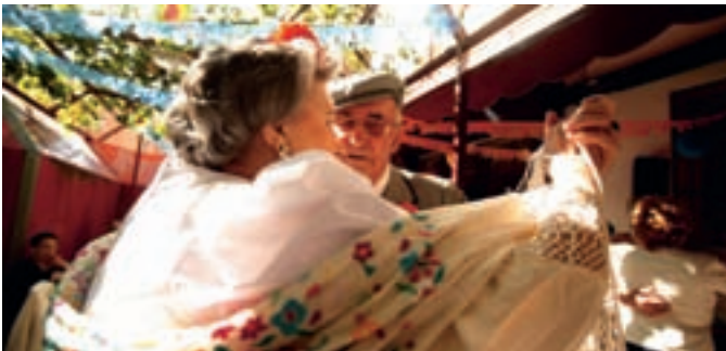
En San Isidro, los mayores de Alcobendas también han estado muy participativos.