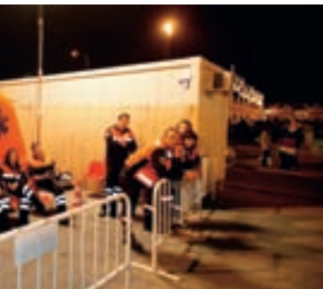
Se ha estado en todo momento por la seguridad.