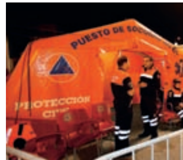
La Policía Local y Protección Civil velaron por la seguridad de los asistentes.