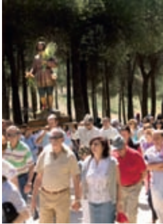
El buen tiempo acompañó el viernes por la mañana a todos los que acudieron al pinar de San Isidro a celebrar la tradicional romería y la procesión del santo.

A buen seguro que muchos vecinos habrán cogido con su cámara los buenos momentos vividos en San Isidro. Invitamos a nuestros lectores a mandarnos sus fotos de las fiestas. En el próximo SietedíaS publicaremos una selección de las mejores imágenes recibidas. Anímate y mándanoslas a mc.comunicacion@aytoalcobendas.org . Recepción de fotos: hasta el martes 26 de mayo, inclusive.