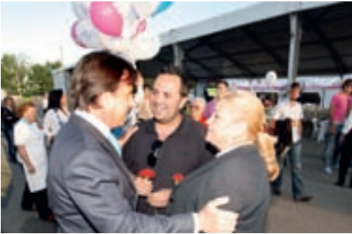
El alcalde ha vivido intensamente las fiestas en contacto con los vecinos.