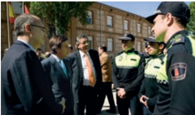
Los agentes, junto con el alcalde y el concejal de Seguridad, en la Academia de Policía Local.

La Policía Local de Alcobendas incorporará a su plantilla a cuatro nuevos agentes, tres de los cuales forman parte del