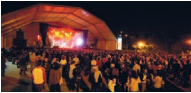
El público bailó, saltó, tarareó... y se divirtió en los conciertos de The Pinker Tones, Tequila y Kiko Veneno.