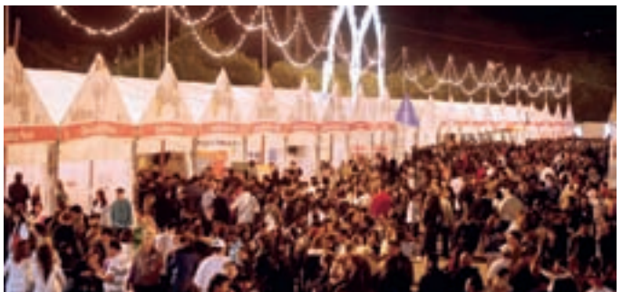
La animación y las ganas de fiesta han marcado el ambiente del recinto ferial.