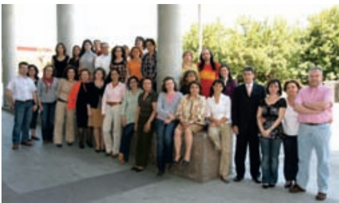
La concejal de Planificación y Calidad junto con el equipo del SAC.

El Ayuntamiento de Alcobendas ha iniciado un proceso de renovación de los compromisos de servicio con los ciudadanos. El primero en abordarse es el correspondiente al Servicio de Atención Ciudadana (SAC), por ser el que da la respuesta más inmediata a las demandas de los vecinos.