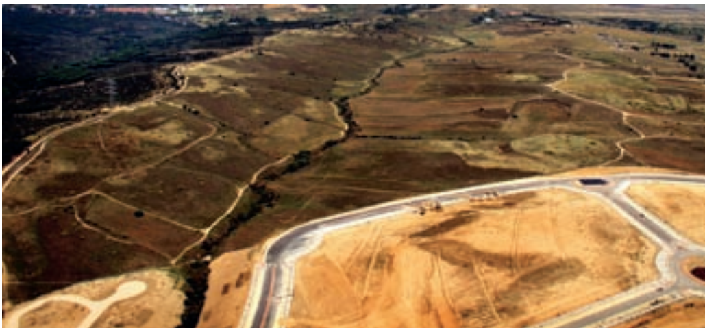
Los Carriles se convierten en zona residencial en este Plan General.

El Consejo de Gobierno de la Comunidad de Madrid ha aprobado el Plan General de Alcobendas. De este modo, el Ejecutivo regional da luz verde al modelo de ciudad que contempla la construcción de 8.600 nuevos pisos, la mitad de los cuales deberán ser protegidos.