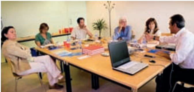
El jurado, deliberando el pasado 25 de junio sobre las candidaturas.

La entrega del Premio Internacional de Fotografía Alcobendas , que contará con la presencia del autor, se realizará el próximo otoño, coincidiendo con el Día Internacional de la Infancia.