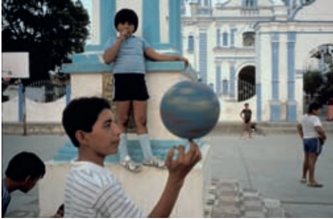
La fotografía ganadora: 'México 1985. Niños jugando en un patio'.

El fotógrafo americano Alex Webb ha sido galardonado con el 'Premio Internacional de Fotografía Alcobendas', en su primera edición. El jurado ha reconocido la presencia delicada e intensa de la infancia en todos sus trabajos.