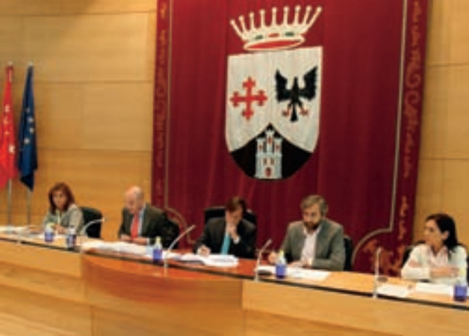
Parte del equipo de gobierno en un momento del Pleno.

El Pleno municipal de Alcobendas ha aprobado el Reglamento del Registro de Familias Numerosas. El objeto de dicho registro es crear una base de datos para regular la concesión de ayudas a las familias numerosas de Alcobendas en las áreas cultural, deportiva, social y de juventud.