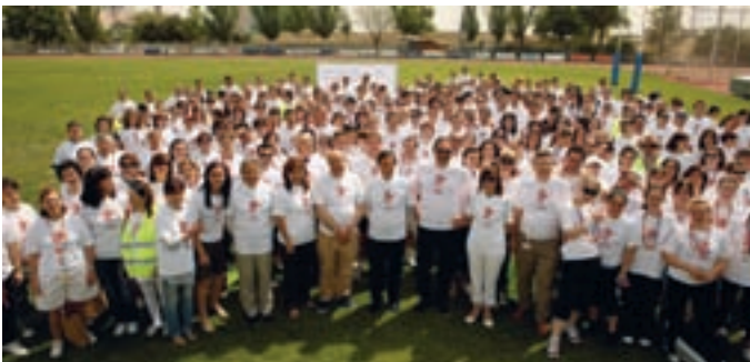
El alcalde y la concejal de Familia y Bienestar Social, en el Día del Voluntariado de Lilly.