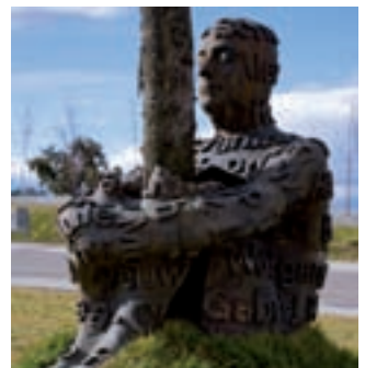
‘El Tren del arte’ enseña a las familias algunas esculturas de la ciudad